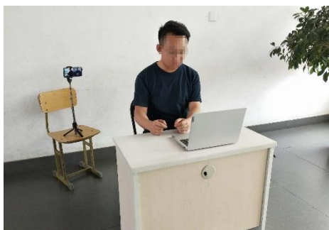
图 1 考生双机位设备摆放布置示意图

双机位拍摄画面显示完整的考生考核环境，即双机位两台设备同时开启摄像头， 第一机位（电脑） 摄像头对准考生本人从正面拍摄（要保证第二机位手机屏幕能被考核专家看到）， 第二机位（手机）前置摄像头 从考生侧后方 45° 拍摄（要保证考生第一机位电脑屏幕能被考核专家组看到，建议使用手机支架，保持第二机位稳定拍摄），考生双机位设备摆放布置示意图如图 1 所示。