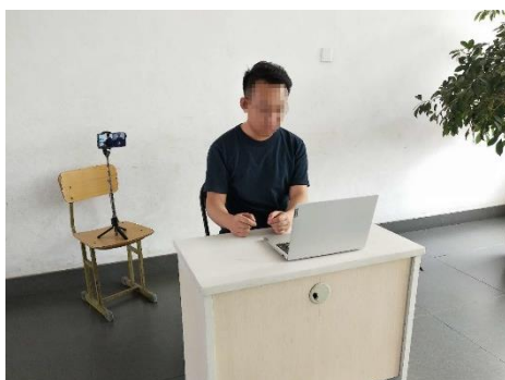
图 1 考生双机位设备摆放布置示意图

双机位拍摄画面显示完整的考生复试环境，即双机位两台设备同时开启摄像头，第一机位（电脑）摄像头对准考生本人从正面拍摄（要保证第二机位手机屏幕能被复试专家看到），第二机位（手机）摄像头从考生侧后方 45° 拍摄（要保证考生第一机位电脑屏幕能被复试专家组看到），考生双机位设备摆放布置示意图如图 1 所示。