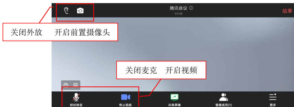
图 2 腾讯会议第二机位设置图

第二机位采用手机的，开启手机屏幕“自动转转”功能，手机横屏拍摄。腾讯会议相关设置结果如图 2 所示。