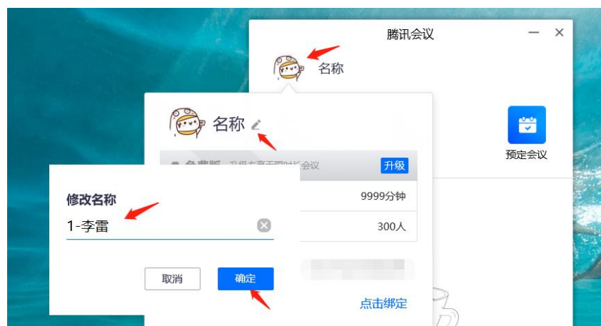
图2 腾讯会议登录名称设置方法