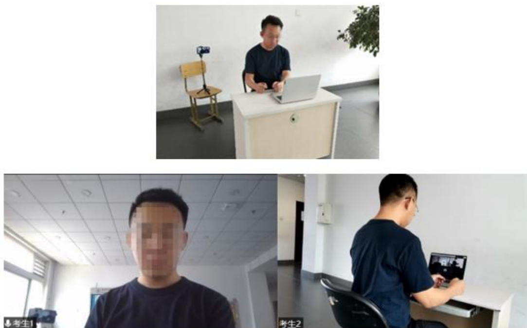
图 1 考生双机位设备摆放布置示意图

双机位拍摄画面显示完整的考生复试环境，即双机位两台设备同时开启摄像头，第一机位（电脑）摄像头对准考生本人从正面拍摄（要保证第二机位手机屏幕能被复试专家看到），第二机位（手机）摄像头从考生侧后方 45° 拍摄（要保证考生第一机位电脑屏幕能被复试专家组看到），考生双机位设备摆放布置示意图如图 1 所示。